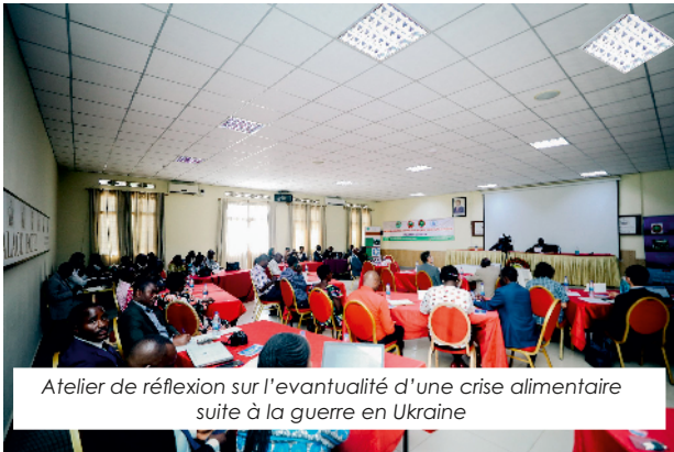
Atelier de réflexion sur l'éventualité d'une crise alimentaire suite à la guerre en Ukraine