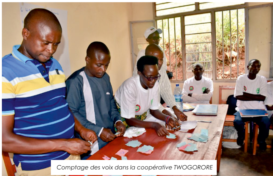
Comptage des voix dans la coopérative TWOGORORE