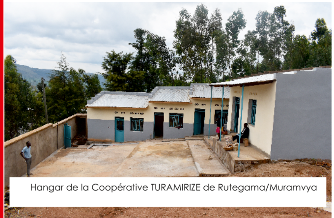
Hangar de la Coopérative TURAMIRIZE de Rutegama/Muramvya