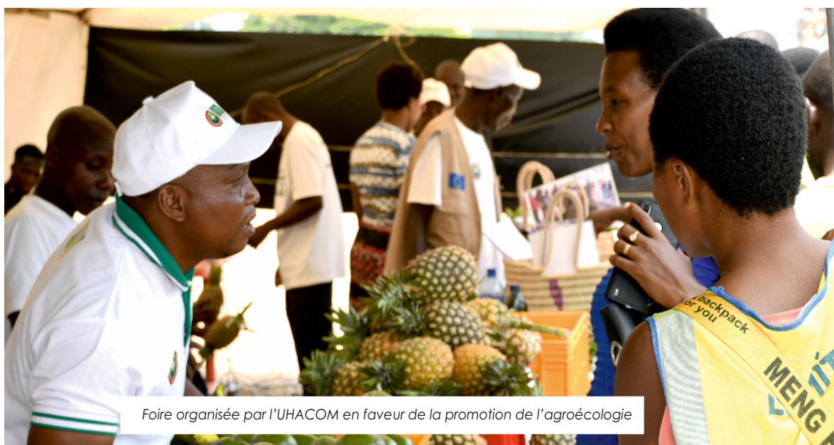
Foire organisée par l'UHACOM en faveur de la promotion de l'agroécologie

Sous l'appui financier de Broederlijk Delen, l'UHACOM a Co-organisé avec les autres partenaires des actions de plaidoyer en faveur de l'agriculture familiale, de l'agroécologie et de l'économie sociale et solidaire.