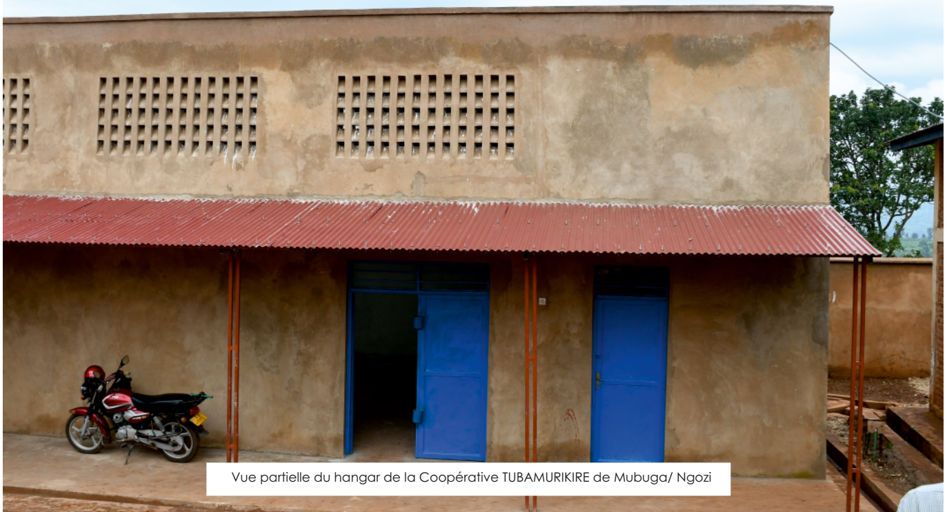
Vue partielle du hangar de la Coopérative TUBAMURIKIRE de Mubuga/ Ngozi