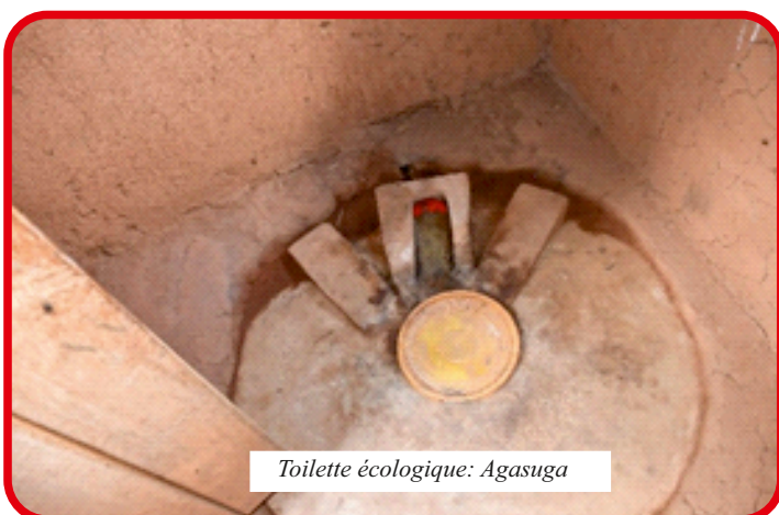
Toilette écologique: Agasuga

Pendant la saison agricole A 2022, quarante-cinq mille neuf cent quatre-vingt-dix-sept (45 997) plants d'arbres agroforestiers (Leucena, Calliandra, Grevillea et Maesopsis), et biopesticides (Neem, Moringa, Tabac, Tephrosia, ricin, papayer) et de fruitiers (Maracuja et prunier) ont été plantés alors que pour la saison agricole B 2022, quarante-six mille quatre cent cinquante-un (46 451) plants d'arbres agroforestiers (Leucena, Calliandra, Grevillea et Maesopsis), et biopesticides (Neem, Moringa, Tabac, Tephrosia, ricin, papayer) et de fruitiers (Maracuja, papayers et prunier) ont été implantées sur 13 sites.