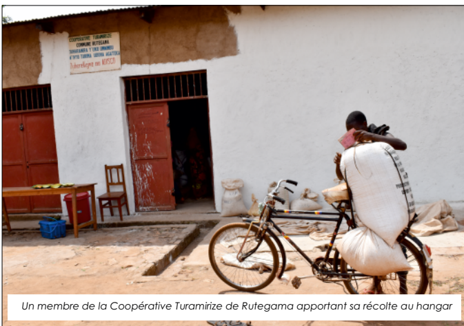
Un membre de la Coopérative Turamirize de Rutegama apportant sa récolte au hangar

C'est un service qui allège considérablement la pénibilité des femmes car ce sont elles qui pilent habituellement le manioc à la main dans leur ménage tous le soir après les travaux champêtres. Les recettes obtenues de ce service de mouture vont contribuer à améliorer l'autofinancement de cette coopérative.