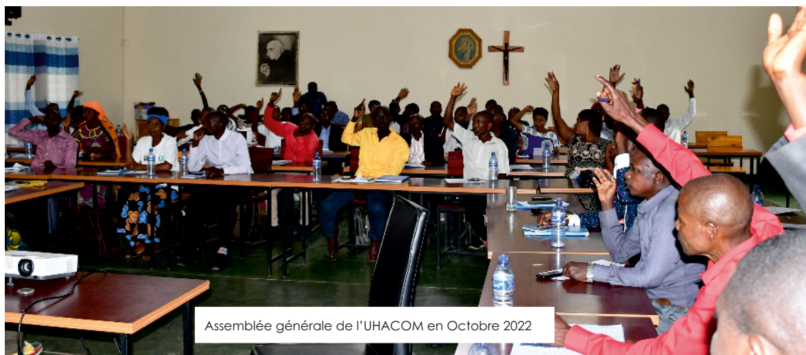
Assemblée générale de l'UHACOM en Octobre 2022

Les organes de l'organisation ont tenu régulièrement les réunions statutaires. L'assemblée générale s'est aussi réunie en octobre 2022 pour évaluer les objectifs de l'AG précédente et définir les horizons des années suivantes. Il a été également l'occasion de valider la demande d'adhésion de la coopérative Turashoboye de Kiremba et de déterminer les filières sur lesquelles leurs coopératives vont concentrer les efforts afin de booster la production agricole de leur coopérative et de l'union en générale. En 2022, l'assemblée générale de l'UHACOM compte 68 membres représentant 34 coopératives. Son Conseil d'administration se compose de 9 membres dont plus de 44% sont des femmes.