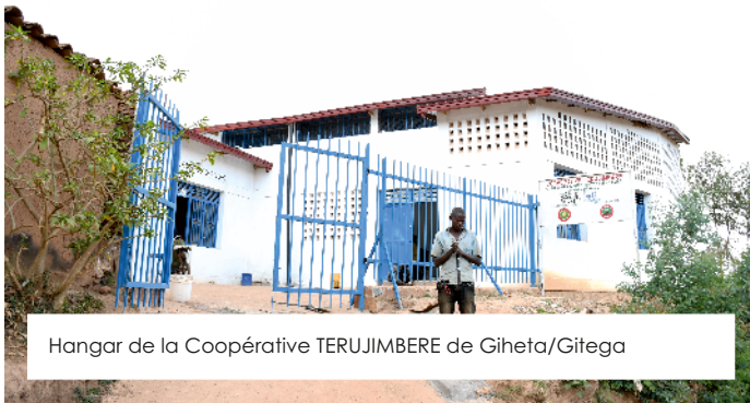
Hangar de la Coopérative TERUJIMBERE de Giheta/Gitega

Avec l'appui financier d'Oxfam Allemagne à travers le projet PRAGRECOL, l'UHACOM a finalisé en 2022 la construction des hangars de stockage et bâtiments annexes de deux coopératives à savoir Terujimbere de Giheta et Turamirize de Rutegama. Elle a également construit un nouveau hangar de stockage de la coopérative Tubamurikire de Ngozi.