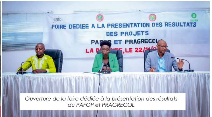
Ouverture de la foire dédiée à la présentation des résultats du PAFOP et PRAGRECOL