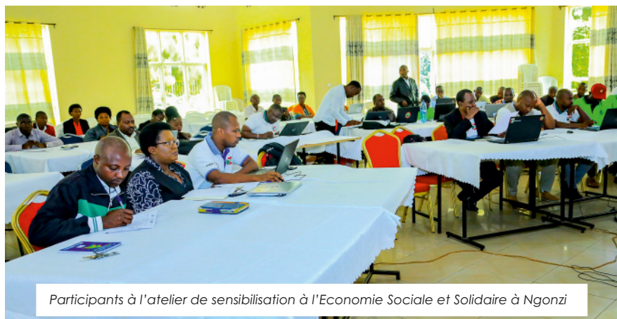
Participants à l'atelier de sensibilisation à l'Economie Sociale et Solidaire à Ngonzi