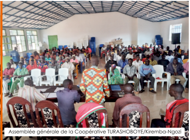
Assemblée générale de la Coopérative TURASHOBOYE/Kiremba-Ngozi