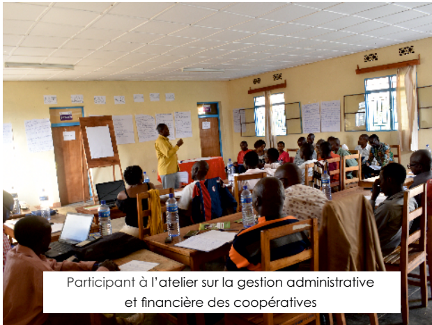
Participant à l'atelier sur la gestion administrative et financière des coopératives

Dans sa responsabilité d'accompagner ses coopératives, l'UHACOM veille au respect de la loi régissant les sociétés coopératives et encourage la participation des femmes et des jeunes dans les instances de prise de décisions.