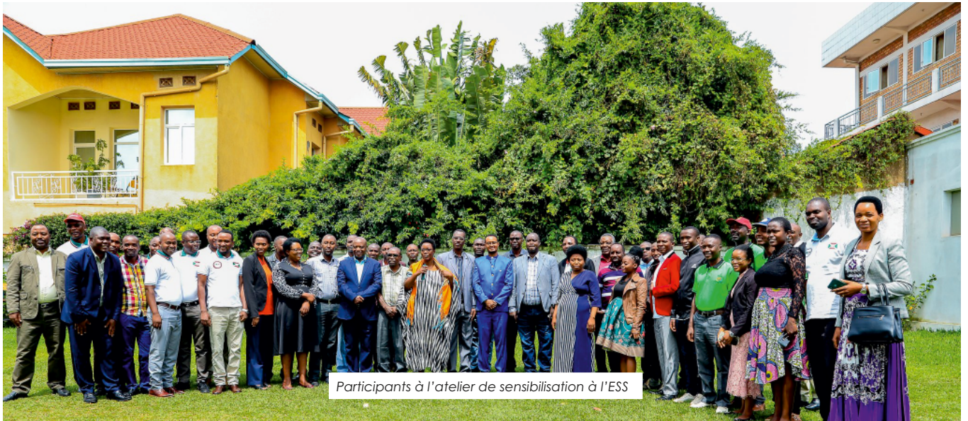
Participants à l'atelier de sensibilisation à l'ESS